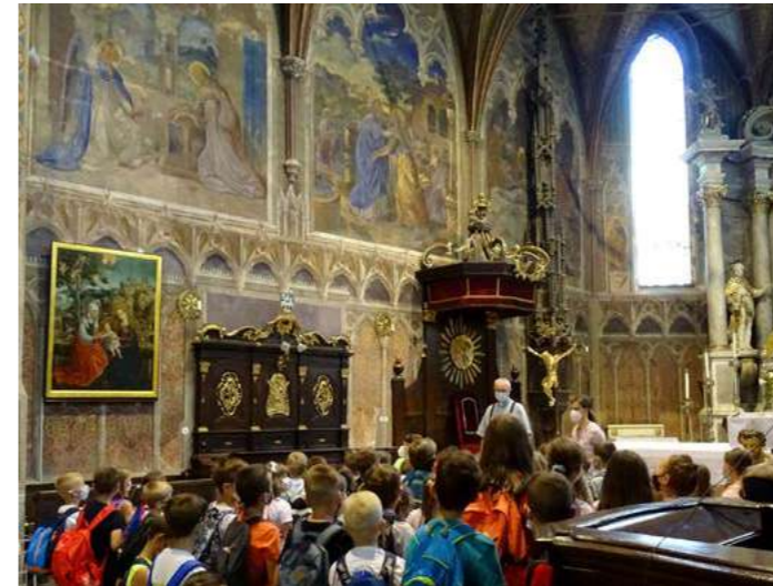
V Katedrále Nanebovzatia Panny Márie