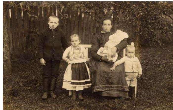
Fotografia - ľudový odev z Vyšnej Slanej, 1923

Modrotlač – džínsovina monarchie. Projekt bol spolufinancovaný z prostriedkov Európskej únie z Európskeho fondu regionálneho rozvoja.