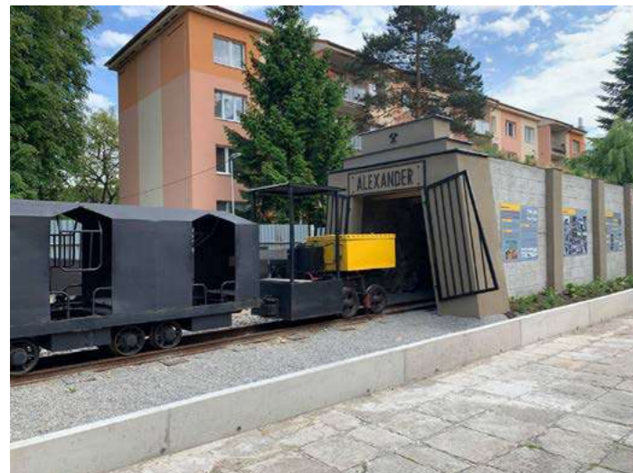
Štôlna Alexander s vláčikom