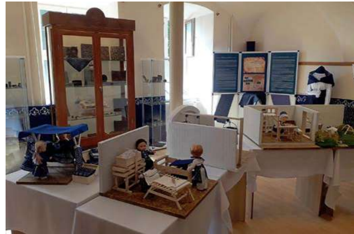
Výstava Zahalená v modrom, Moldava nad Bodvou, 24. júna 2021