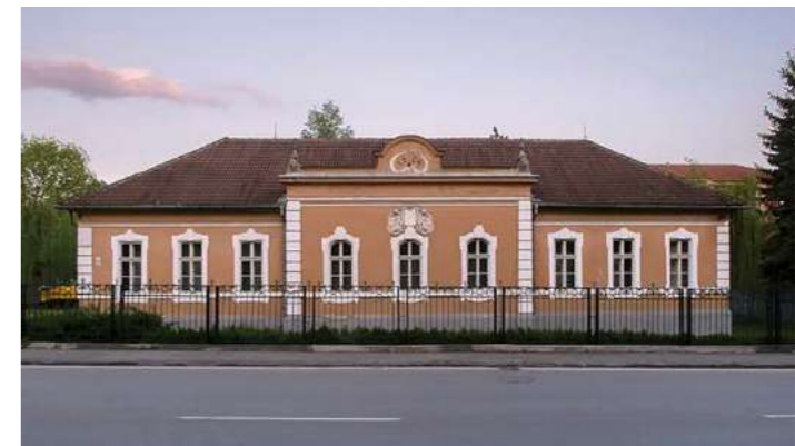
Súčasný pohľad na budovu bývalého chudobinca grófký Františky Andrásyovej v Rožňave