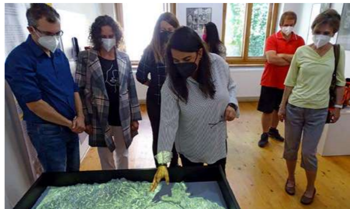
3D mapa na otvorení výstavy