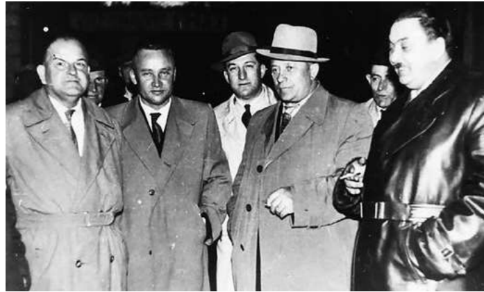
Sovietski partizánski velitelia v Rožňavskom okrese, 1964

Gemer patril k jedným z najrevolučnejším krajom. Do boja za oslobodenie krajiny sa aktívne zapojili i ženy.