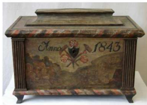
Truhlica cechová, pravdepodobne rožňavského cechu baníkov, 1843. Zbierkový fond BM.