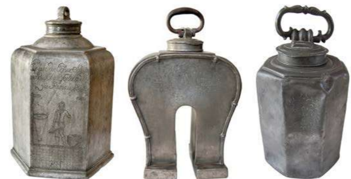
Kanva cechu farbiarov a modrotlačiarov, 1732. Zbierkový fond BM.

Okrem úžitkovej funkcie plnili kanvy aj obradnú, reklamnú a v neposlednom rade aj reprezentatívnu funkciu. Spolu s ďalšími cechovými nádobami, medzi ktoré patrili krčahy, džbány, fľaše, čutory, pinty, poháre a taniere rozmanitej podoby, sa používali na hostinách a pri cechových obradoch. Spomínané cechové kanvy, vyrobené