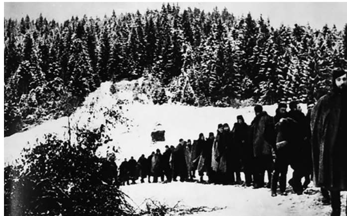
Partizánsky štáb riadi ústup do hôr

notenie a pôsobenie partizánov počas druhej svetovej vojny pomerne zložitá, je dôležitá najmä istý kompromis medzi subjektívnym hodnotením partizánskeho hnutia a objektívnou realitou.