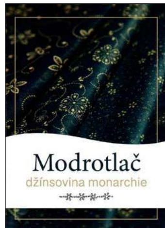
Brožúra Modrotlač – džínsovina monarchie, Moldava nad Bodvou 2021

Mestské kultúrne stredisko v Moldave nad Bodvou prezentovalo počas leta, od 24. júna do 30. júla 2021, modrotlačiarске remeslo prostredníctvom popularizačnej výstavy, ktorá bola realizovaná s podporou Fondu malých projektov z Programu cezhraničnej spolupráce Interreg V-A Slovenská republika – Maďarsko, v rámci projektu