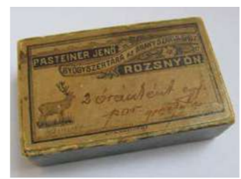
Krabička od liekov z lekáreň J. Pasteinera s dávkovaním, zač. 20. stor. Zbierkový fond BM.

Dnes nám túto vzácnu, architektonicky zaujímavú budovu pripomínajú už len dobové fotografie a tvorba výtvarných umelcov, ktorí lekáreň zvečnili na svojich plátnach. Vzácnym svedectvom Pasteinerovej lekáreň Aranyszarvas v Rožňave sú krabičky od liekov evidované v historickom fonde Banického múzea v Rožňave.