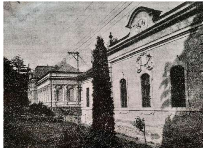
Pohľad na budovu chudobinca, pravdepodobne 40. roky 20. storočia

ďalších 10 000 korún na vybudovanie pivničných priestorov, dvora a plota okolo postavenej budovy. Pozemok, na ktorom by mala byť budova chudobinca postavená, daroval mestu gróf Gejza Andrásy. Starosta dňa 30. novembra 1902 oboznámil mestské zastupiteľstvo s obsahom listu Istvána Sulyovszkého, ktoré prijalo a odsúhlasilo dar Dionýza Andrásyho na svojom zasadnutí 10. decembra 1902.