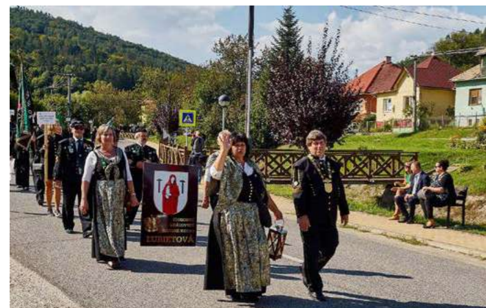
Slávnostný sprievod obcou Nižná Slaná

Tu sa potom účastníci zoradili do slávnostného sprievodu, ktorý býva súčasťou každého takéhoto stretnutia.