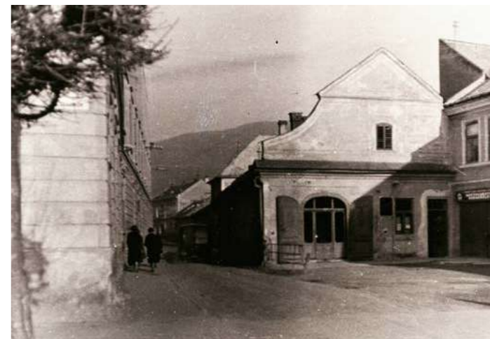
Budova lekáreň Aranyszarvas.