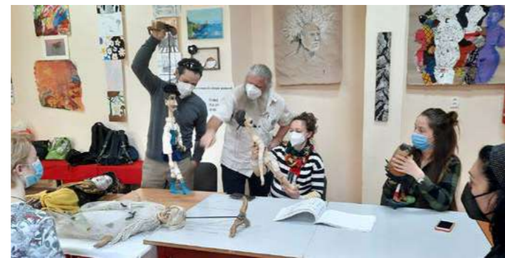
Metodický deň – odborné vzdelávanie pedagógov a zástupcov školských, kultúrno-vzdelávacích a sociálnych inštitúcií